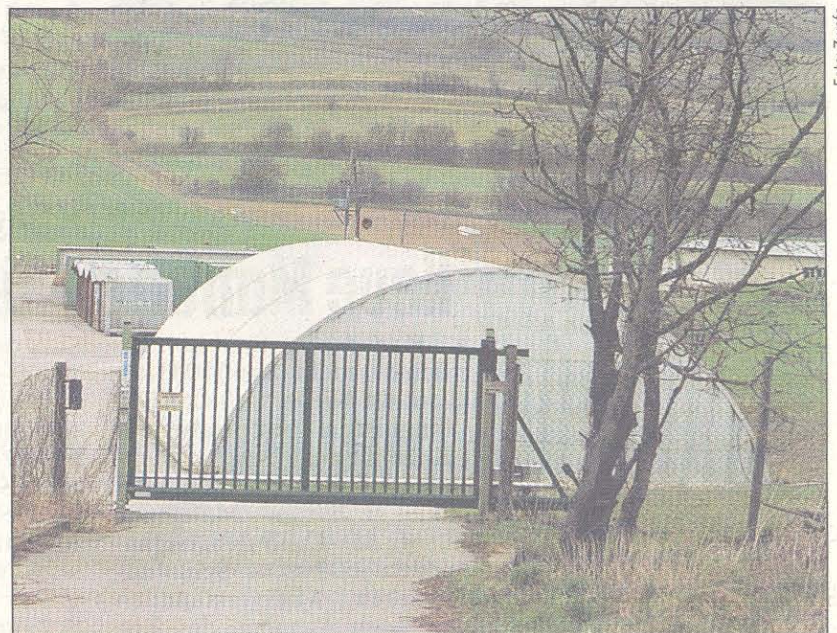
Rund um die Fabrik fand die Polizei weitere drei 25-Kilo-Pakete mit dem Pulver

Ganz in der Nähe des „Fundortes“ steht eine Feuerwerksfabrik. Der Besitzer: „Bei mir ist alles unter Verschluss. Keine Ahnung, wo die Kinder das Pulver herhaben.“